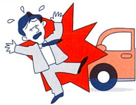
死亡・後遺障害保険金