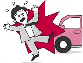
死亡・後遺障害保険金